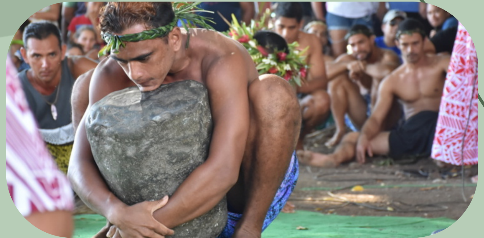
Lever de pierre