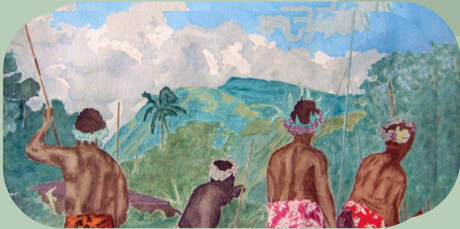
Lancer de javelot